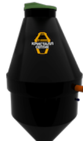
Септик Кристалл 8 Лонг