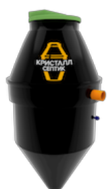
Септик Кристалл 5